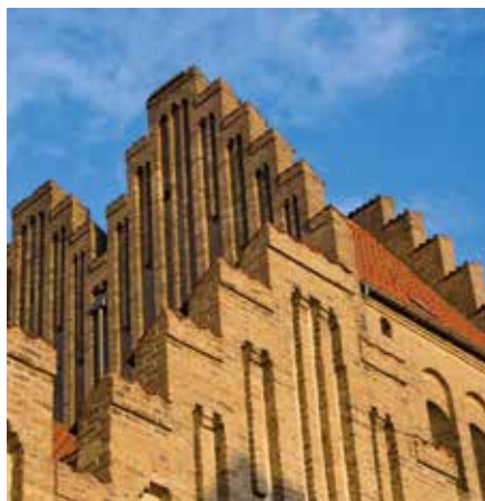
På gensyn i Fredens Kirke 2017.

For at få del i julehjælp kræver det, at man udfylder et ansøgningskema. Det kan fås ved henvendelse til kirkekontoret.